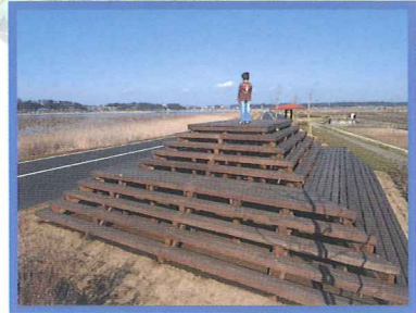
ピラミッド展望台