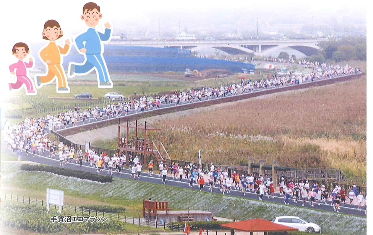
手賀沼エコマラソン

凡例 緑道内施設 休憩スペース(あずまや・眺望デッキ等) P 駐車場 周辺施設 水飲み場 駐輪場 トイレ