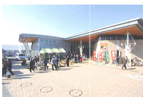
6 道の駅しょうなん

凡例 緑道内施設 休憩スペース(あずまや・眺望デッキ等) P 駐車場 周辺施設 水飲み場 駐輪場 トイレ