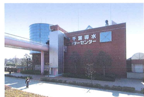
2 国土交通省北千葉第二機場 (北千葉導水ビジターセンター)