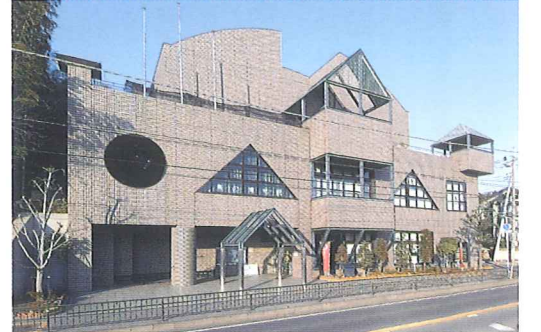
5 我孫子市鳥の博物館

なお、この緑道は都市公園である「緑道」と沼側の自転車道で構成され、全体を「手賀沼自然ふれあい緑道」と称しています。