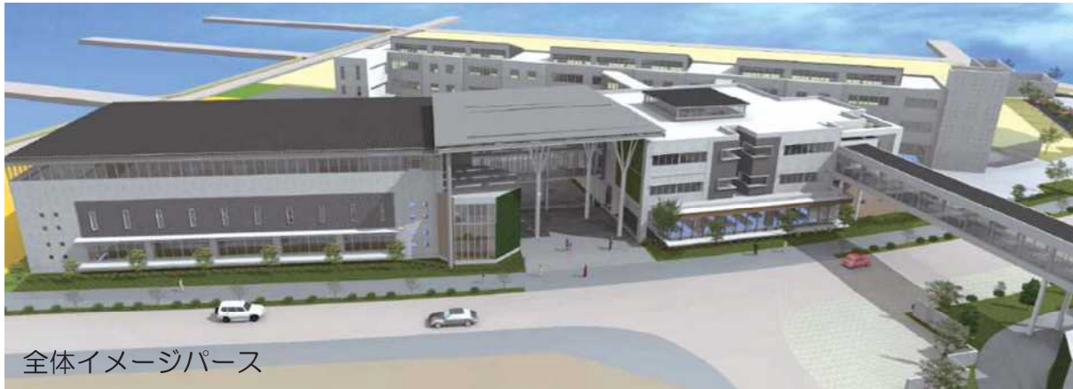
全体イメージパース