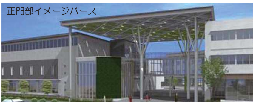
正門部イメージパース