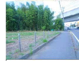
十十二船戸線（都市計画道路）の興道守谷流山線との立体交差部での橋梁の下部工の工事が始まります。