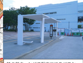
柏の葉キャンパス駅東口にもバスシェルの設置工事を行っています。