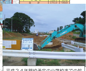
平成24年開校予定の小学校までの幹線道路を築造しています。

整備中は皆様には何かと迷惑をおかけしますが、ご協力の程、宜しくお願いいたします。