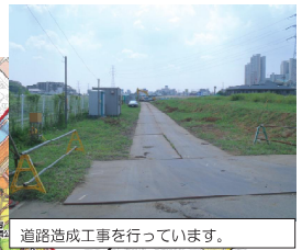
道路造成工事を行っています。