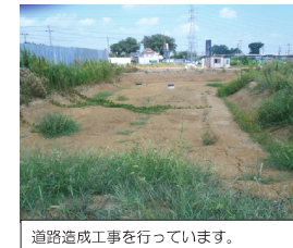
道路造成工事を行っています。