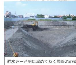
雨水を一時的に溜めておく調整池の築造工事を行っています。（5号調整池）