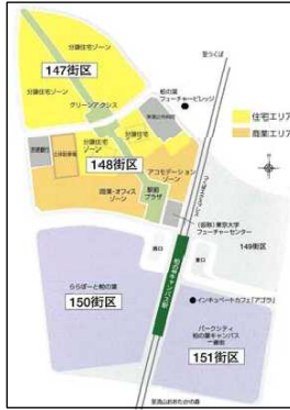
【147街区 148街区 位置図】