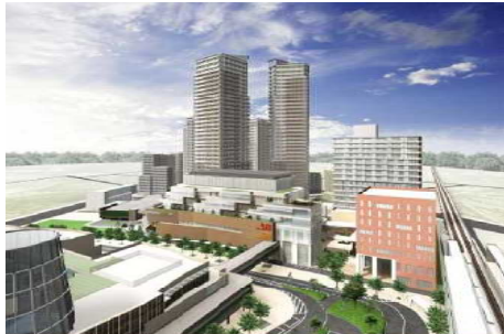
147街区で建築中のマンション

建築が進んでいるマンションにつきましては、平成22年4月に一部の棟の竣工予定を初めとし平成24年4月にはすべての棟が竣工する予定です。そして隣接する148街区においては、商業施設、オフィスビル、ホテル、賃貸マンションなどが平成24年度の完成を目指して建設されます。