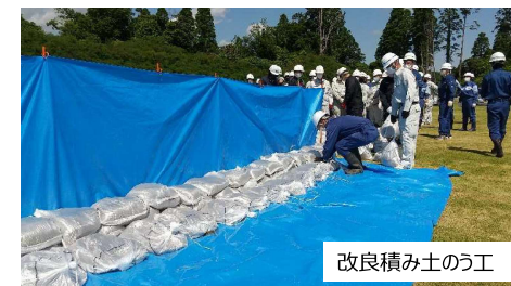
改良積み土のう工