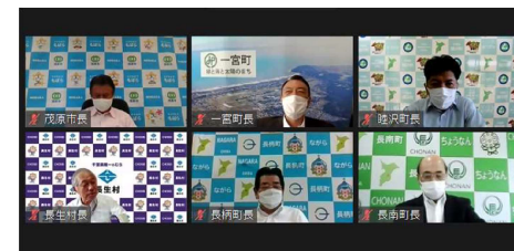
第4回一宮川流域治水協議会の様子

協議会では、河川整備の実施状況、流域対策の課題等を共有したうえで、以下について合意しました。