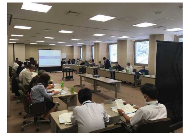
5月31日 長柄町部会の状況