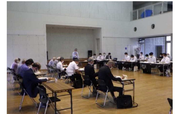
5月24日 茂原市部会の状況