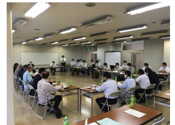
5月25日 長南町部会の状況