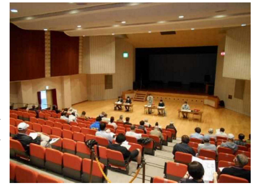
5月16日 説明会の状況

地権者の皆様におかれましては、お忙しいところ、御出席していただき、ありがとうございました。