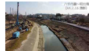
ドローン動画イメージ