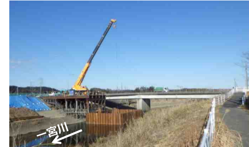
東橋橋梁架け替え工事の状況 (令和4年2月撮影)