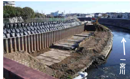
茂原市街地の護岸法立で工事の状況 (令和4年2月撮影)