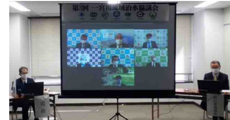
第3回一宮川流域治水協議会の様子