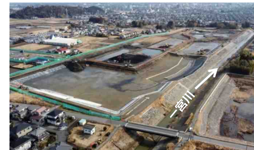
第二調節池の掘削状況 (令和4年2月撮影)