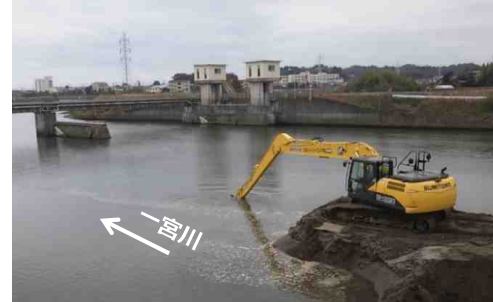
松瀧堰上流の堆積土砂撤去の状況 (令和3年12月撮影)

引き続き、工事及び用地取得などについて、ご理解・ご協力のほどどうぞよろしくお願いいたします。