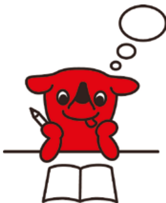
千葉県マスコットキャラクター チーバくん