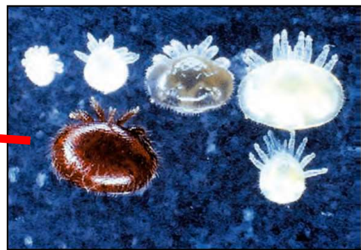
ミツバチヘギイタダニ