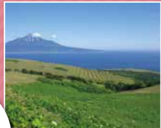
礼文島から望む利尻岳

がん専門病院である千葉県がんセンターを基幹型病院とし、他の県立5病院（千葉県総合救急災害医療センター、千葉県こども病院、千葉県循環器病センター、千葉県立佐原病院、千葉県千葉リハビリテーションセンター）及び千葉東病院、ジェイコー千葉病院など12の協力型病院、保健所や地域病院など8の協力施設により、構成しています。