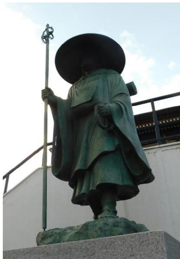
弘法大師像 (市川市 神明寺)