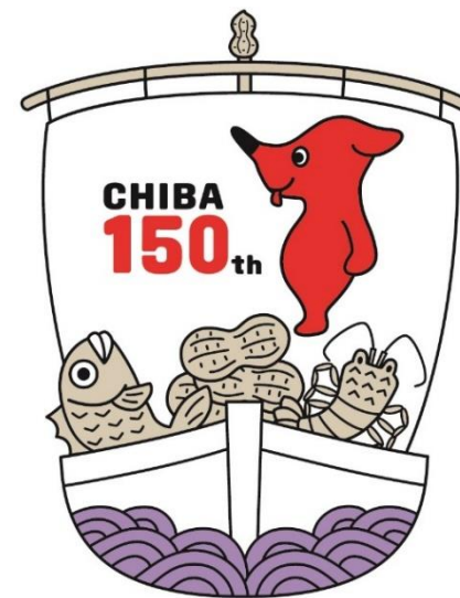
千葉県マスコットキャラクター 「チーバくん」