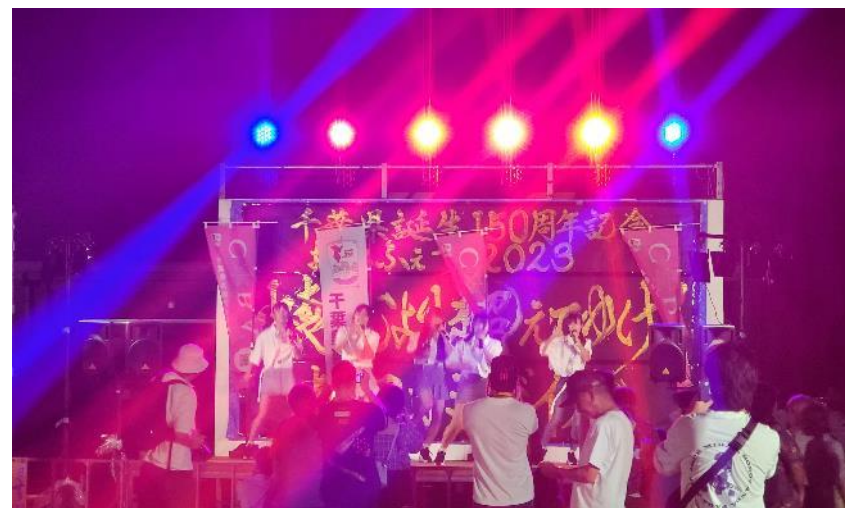
34 香取市 おみふえす 8月1日(火) くらべ運動公園