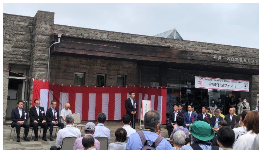
14 習志野市 谷津干潟の日事業6月10日(土)・11日(日)谷津干潟フェス他 谷津干潟