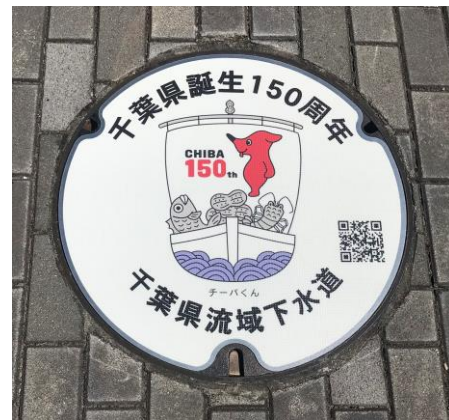
デザインマンホール