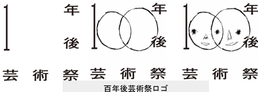
百年後芸術祭ロゴ