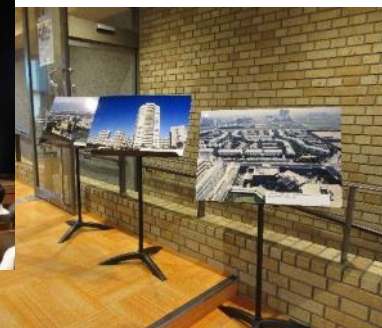
25 浦安市 シンポジウム「海面埋立事業による発展の歴史とこれからの展望」 7月15日(土) 浦安市文化会館