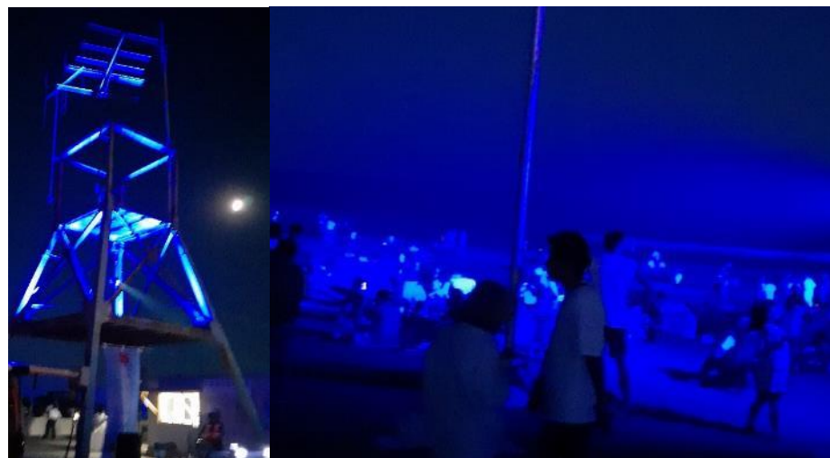
37 大網白里市 Shirasato Night Blue Beach・おおあみしらさとの花火 7月29日(土) 白里海岸