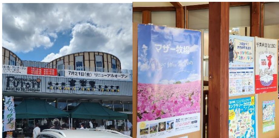
32 南房総市 道の駅リレーイベント 7月21日(金)～23日(日)、11月にも実施予定 富楽里とみやま