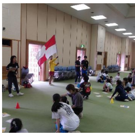
13 旭市 ぼるぼろ(Plplo)(第1回) (Play(遊ぶ),Learn(学ぶ),Protect(守る) and Live(暮らす) with the Ocean(海)) 6月11日(土)いいおかユートピアセンター