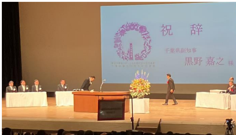
08 野田市 野田市健康スポーツ文化都市宣言記念式典 5月3日(祝)野田ガスホール