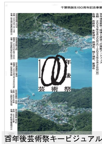
百年後芸術祭キービジュアル

(ロゴの“00”はデザイナーの皆川明氏が、キービジュアルのロゴの“00”は県内の子どもたちが描いたもの。)