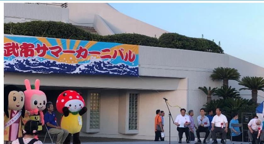
35 山武市 山武市サマーカーニバル 7月29日(土) 蓮沼海浜公園展望塔前広場