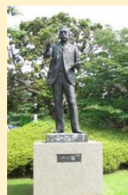
大須賀力《浅井忠像》