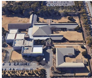
現在の様子（Google Earth による画像）