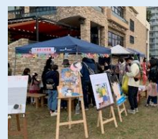
令和3年度の地域イベント参画の様子