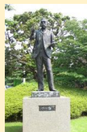
大須賀力《浅井忠像》