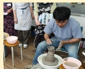
実技講座（陶芸）の様子