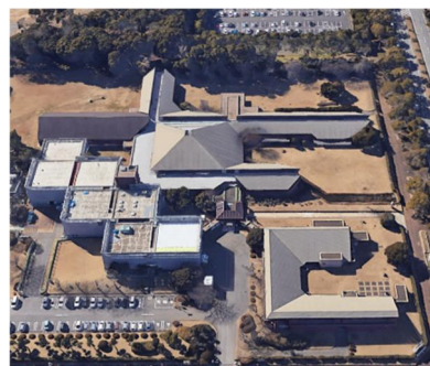
現在の様子（Google Earth による画像）