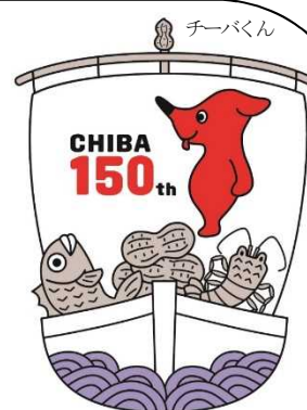
150周年記念ロゴマーク

県が実施する記念式典等の行事、市町村が上記のテーマ及びコンセプトに沿った事業、民間企業等による記念行事を県内各地で実施