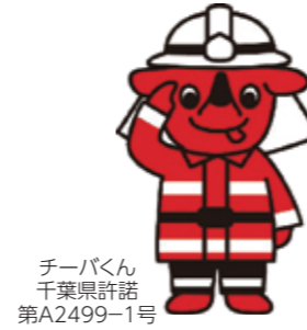
チーバくん 千葉県許諾 第A2499-1号