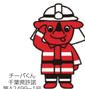
チーバくん 千葉県許諾 第A2499-1号