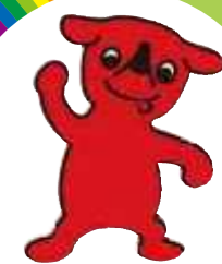
千葉県マスコットキャラクター「チーバくん」

東日本大震災の教訓を踏まえ、災害発生時の被害の最小化を図るには、自助・共助の取組が不可欠であることから、県はもとより県民、事業者、自主防災組織などの役割や取組事項を明らかにし、自助・共助の取組を一層推進するため、「千葉県防災基本条例」を制定しました。