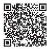
携帯電話版QRコード