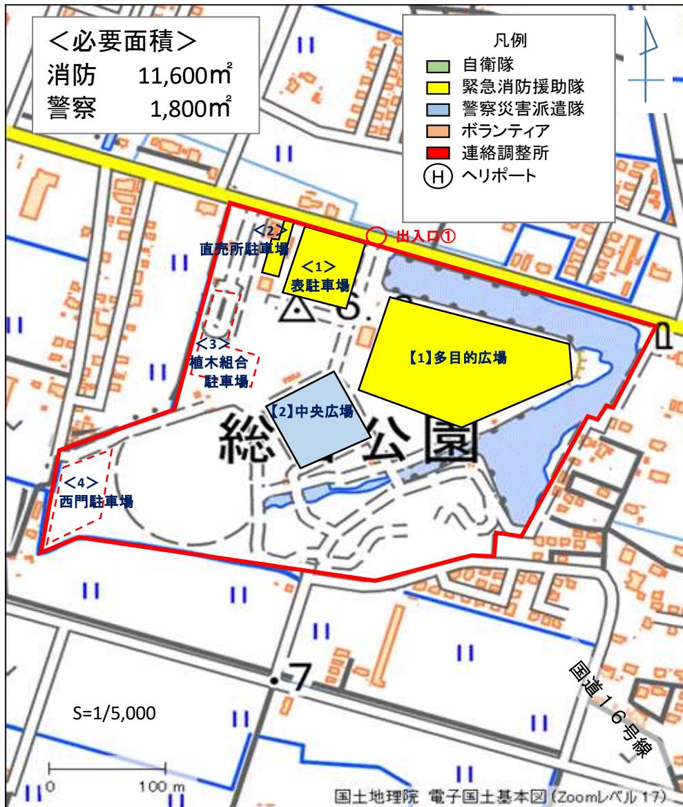
広域防災拠点内の場所及び施設の利用計画