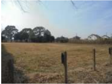
施設内広場等の状況 及び 施設への出入口の状況