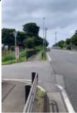
緊急輸送道路から 側道へ（左折）