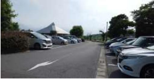
施設内広場等の状況 及び 施設への出入口の状況