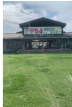
施設内広場等の状況 (ふれあい広場から見た建物)