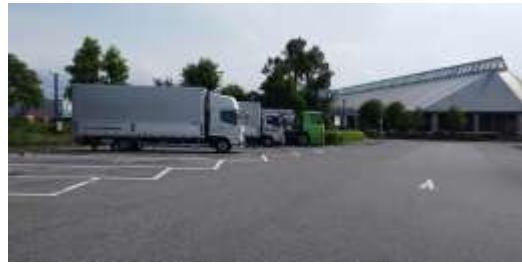
施設内広場等の状況 及び 施設への出入口の状況