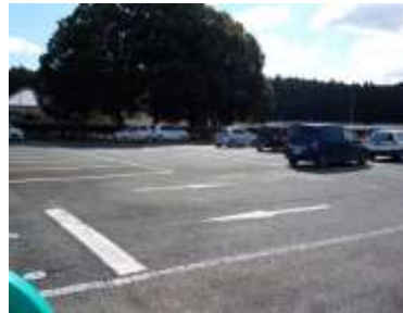
出入口②の状況 2車線分の道路幅がある