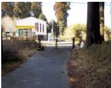
出入口③の状況 2車線分の道路幅がある