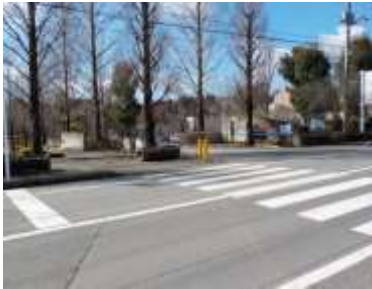
出入口①の状況 2車線分の道路幅がある