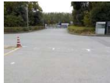
出入口⑥の状況 3車線分の道路幅がある