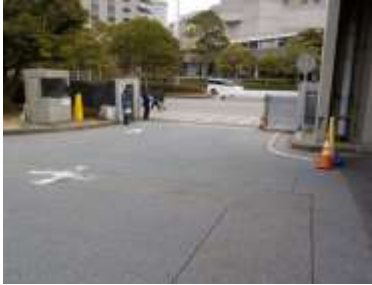
出入口①の状況 2車線分の道路幅がある