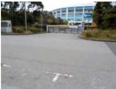
出入口④の状況 3車線分の道路幅がある