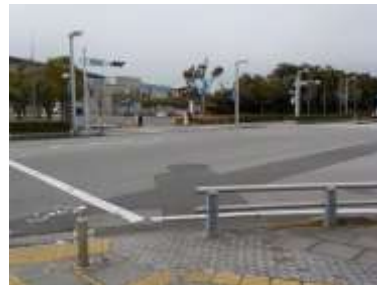
出入口②の状況 4車線分の道路幅がある