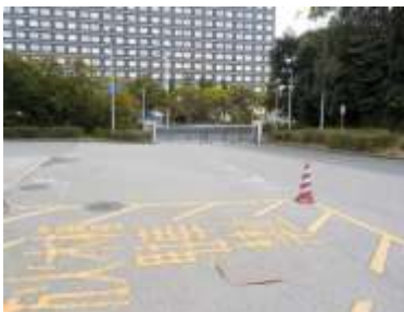
出入口⑦の状況 2車線分の道路幅がある