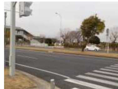
出入口④の状況 2車線分の道路幅がある