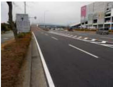
出入口③の状況 2車線分の道路幅がある