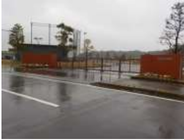
出入口①の状況 2車線分の道路幅がある