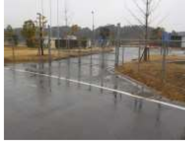
出入口②の状況 1車線分の道路幅がある