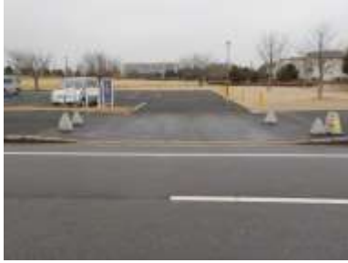
出入口①の状況 2車線分の道路幅がある