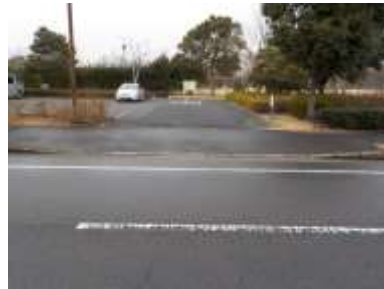
出入口④の状況 2車線分の道路幅がある