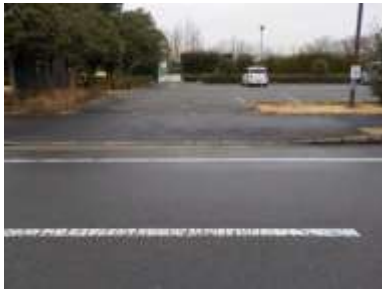
出入口③の状況 2車線分の道路幅がある