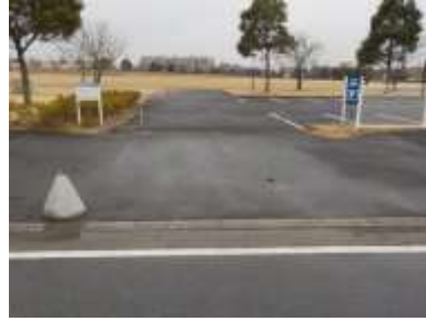
出入口②の状況 2車線分の道路幅がある