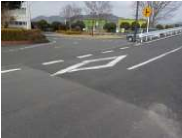
出入口①の状況 2車線分の道路幅がある