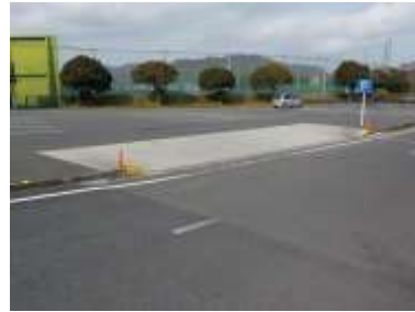
出入口②の状況 2車線分の道路幅がある