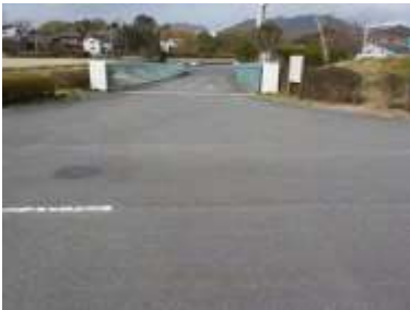
出入口③の状況 2車線分の道路幅がある