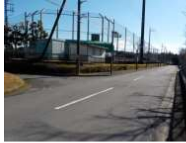
出入口②の状況 2車線分の道路幅がある