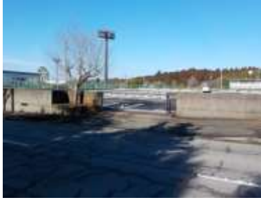
出入口①の状況 2車線分の道路幅がある