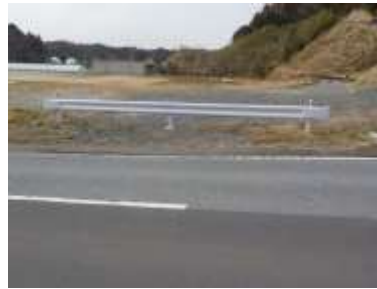
出入口④の状況 2車線分の道路幅がある ※陸上競技場への進入路 幅員 4m