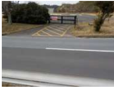
出入口③の状況 2車線分の道路幅がある ※陸上競技場への進入は不可