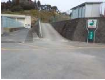
施設への出入口の状況 幅員は3m