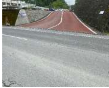
出入口②の状況 2車線分の道路幅がある