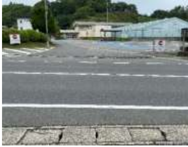
出入口①の状況 2車線分の道路幅がある