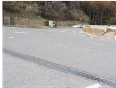
出入口②の状況(駐車場側) 2車線分の道路幅がある