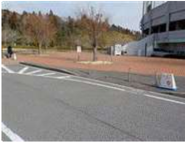
出入口①の状況(野球場側)