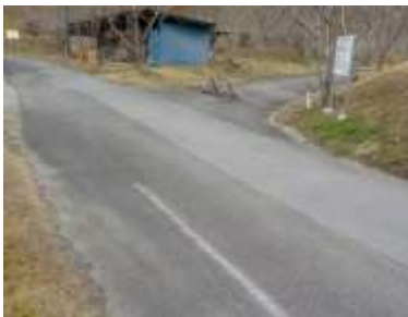
出入口③の状況 1車線分の道路幅がある