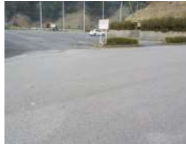
出入口②の状況 2車線分の道路幅がある