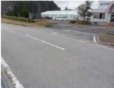
出入口①の状況 2車線分の道路幅がある