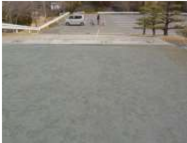
施設への出入口の状況 ※駐車場からのスロープあり