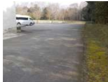
施設内広場等の状況 （駐車スペース）