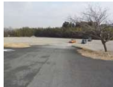
施設内広場等の状況 ※中央部の段差で二分割されている