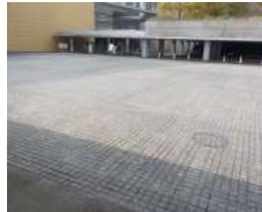
施設内広場等の状況 （地下駐車場入り口）