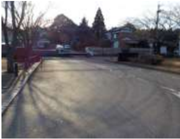
出入口①の状況（正門） 2車線分の道路幅がある