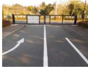
出入口②の状況（東門） 1車線分の道路幅がある