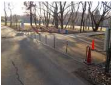
出入口③の状況 1車線分の道路幅がある