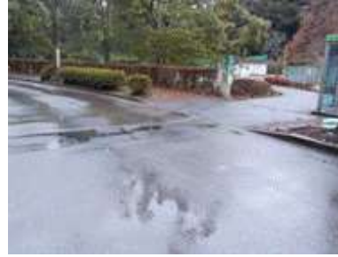
出入口②の状況 2車線分の道路幅がある