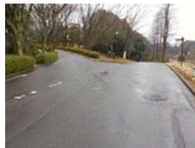
出入口④の状況 2車線分の道路幅がある