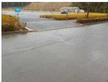
出入口⑦の状況 2車線分の道路幅がある