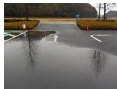
出入口⑥の状況 2車線分の道路幅がある