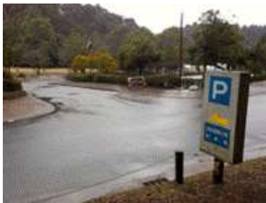
出入口③の状況 2車線分の道路幅がある