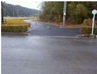
出入口⑤の状況 2車線分の道路幅がある