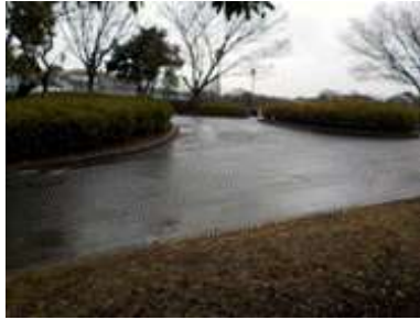
出入口①の状況 1車線分の道路幅がある