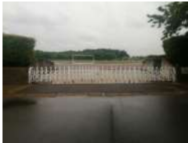
施設への出入口の状況 (出入口①側)