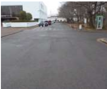
体育館北側の通路 (正面奥が陸上競技場)