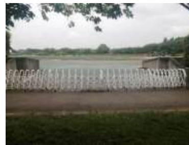
施設への出入口の状況 (駐車場<2>側)