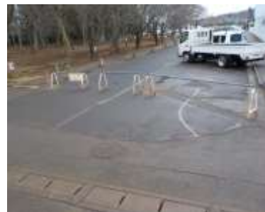
体育館北側の通路 (陸上競技場側から入口方向)