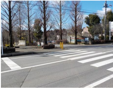
出入口①の状況 2車線分の道路幅がある