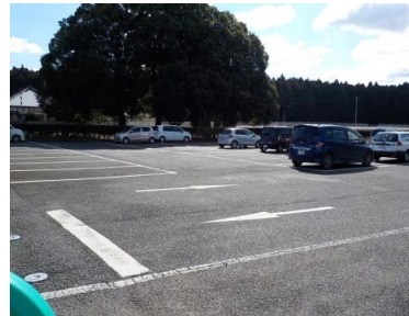
出入口②の状況 2車線分の道路幅がある