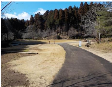
施設への出入口の状況