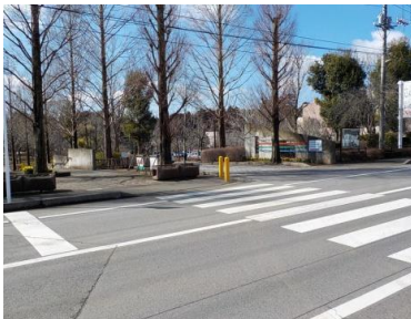
施設への出入口の状況