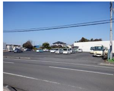
施設内広場等の状況