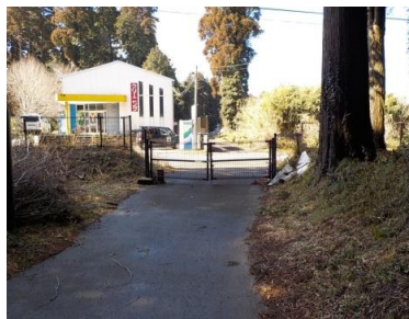
出入口③の状況 2車線分の道路幅がある