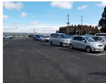
施設内広場等の状況