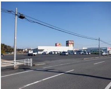
施設への出入口の状況