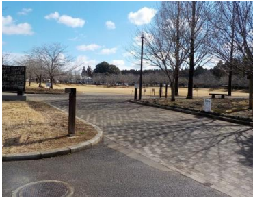
施設への出入口の状況