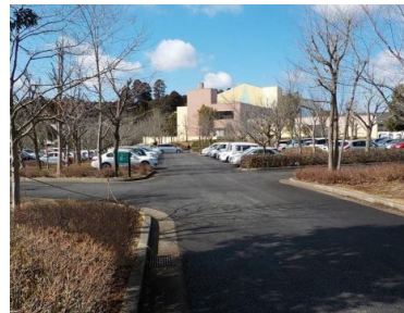
施設内広場等の状況