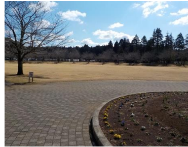
施設内広場等の状況