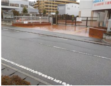
出入口①の状況 2車線分の道路幅がある