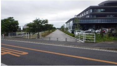
出入口③の状況 2車線分の道路幅がある