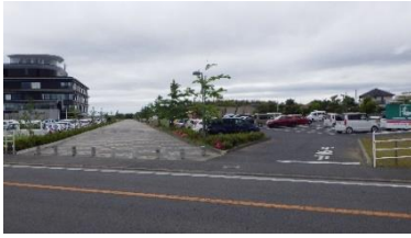
出入口①の状況 2車線分の道路幅がある