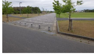
出入口②の状況 2車線分の道路幅がある