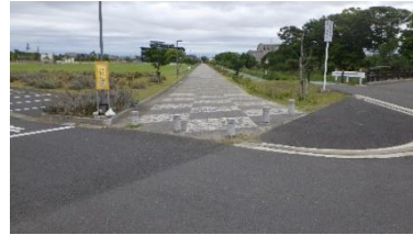
出入口④の状況 2車線分の道路幅がある