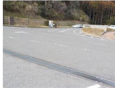
出入口②の状況（駐車場側） 2車線分の道路幅がある