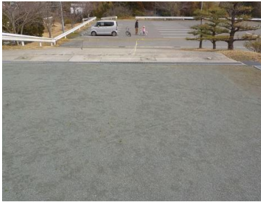
施設への出入口の状況 ※駐車場からのスロープあり