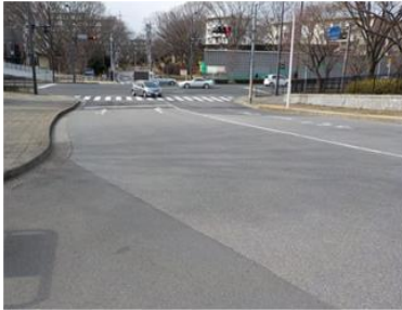
出入口①状況 4車線分の道路幅がある