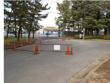
出入口⑥状況 2車線分の道路幅がある