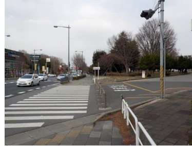
出入口②状況 4車線分の道路幅がある