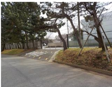
出入口③状況 2車線分の道路幅がある