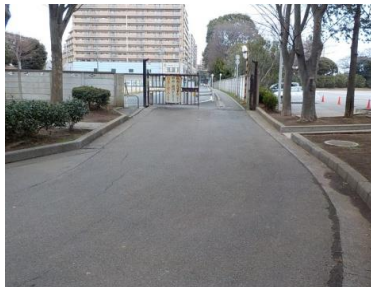
出入口*1状況 2車線分の道路幅がある(ガードレールあり)