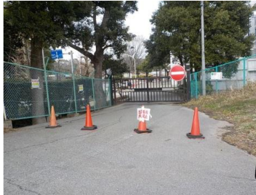
出入口⑤状況 2車線分の道路幅がある