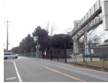
出入口④状況 2車線分の道路幅がある