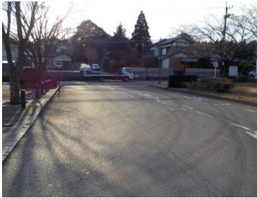
出入口①の状況（正門） 2車線分の道路幅がある