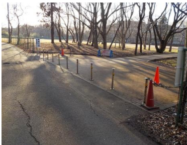
出入口③の状況 1車線分の道路幅がある