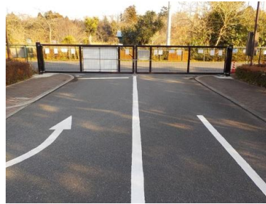
出入口②の状況（東門） 1車線分の道路幅がある