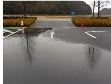
出入口⑥の状況 2車線分の道路幅がある