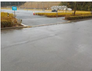
出入口⑦の状況 2車線分の道路幅がある