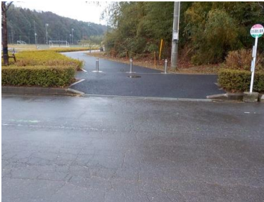
出入口⑤の状況 2車線分の道路幅がある