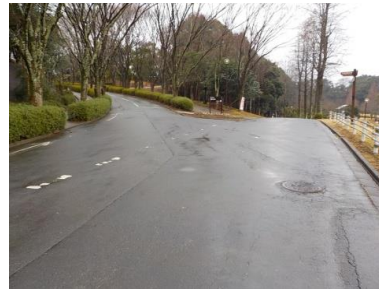
出入口④の状況 2車線分の道路幅がある