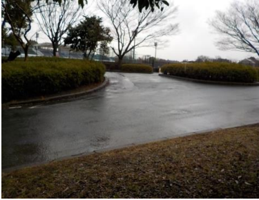
出入口①の状況 1車線分の道路幅がある