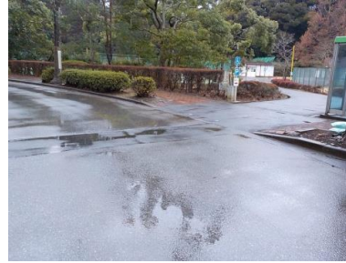
出入口②の状況 2車線分の道路幅がある