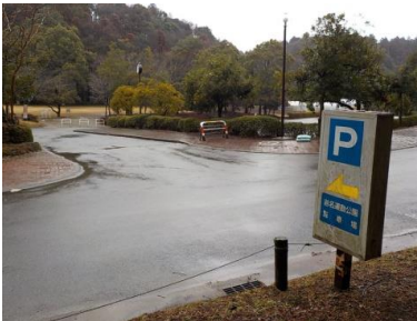
出入口③の状況 2車線分の道路幅がある