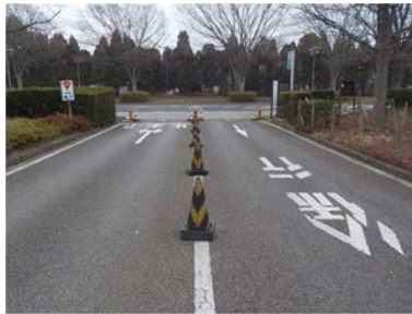
出入口⑤の状況 3車線分の道路幅がある