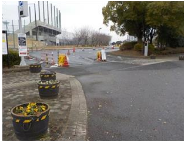
出入口①の状況 2車線分の道路幅がある