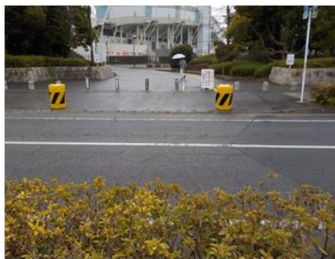
出入口③の状況 2車線分の道路幅がある