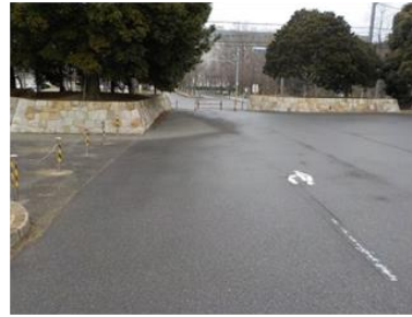
出入口②の状況 2車線分の道路幅がある