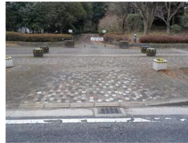
出入口⑥の状況 3車線分の道路幅がある