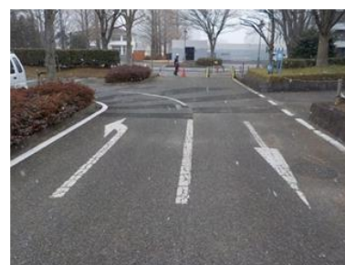
出入口④の状況 3車線分の道路幅がある