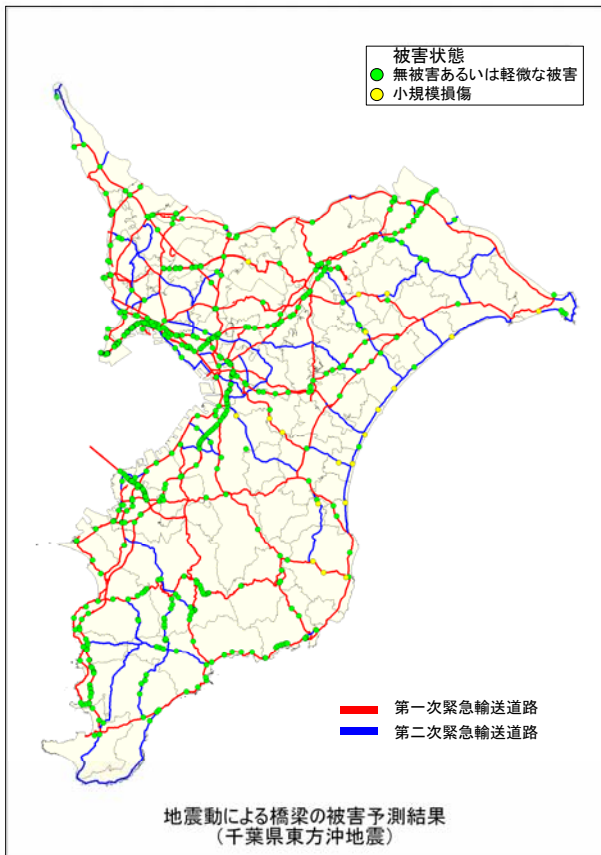
千葉県東方沖地震