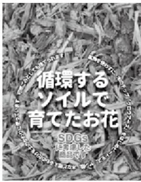
「燃やせる土」の 説明ラベル