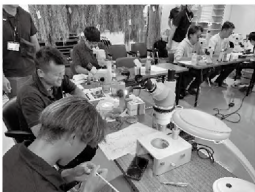
花芽の生理生態を知る