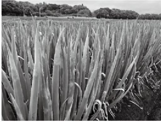
べと病の激発圃場

近年、東葛飾地域のねぎにおいてべと病の被害が多発しています。ねぎが本病に感染すると、葉身に暗緑色で楕円形の病斑を生じ、症状が進むと枯死します。多発すると収量・品質が低下するので、防除のポイントを押さえ、まん延を防止しましょう。