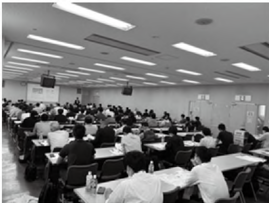
熱心に講演を聞く参加者

は、経営品目や地域が異なる参加者同士で積極的に話し合いが行われました。また、質疑応答では、事業継承の悩みや、経営改善はどのように優先順位をつけて実践していったかなどの質問が寄せられました。研修会後には「自分の経営を見直す良い機会になった！」との声もあり、有意義な研修会となりました。