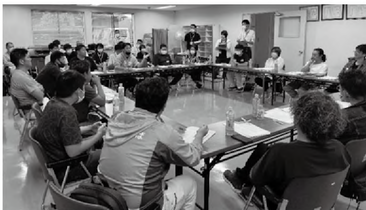
日々の疑問について意見交換

農業事務所では、JA西印旛、JAとうかつ中央、JA全農ちば、印旛農業事務所と連携し、東葛・北総地域で新たにいちご栽培に取り組む生産者23名を対象に、栽培技術の習得と地域の垣根を越えたネットワーク構築を促すために研修会を開催しています。 本年度は、農薬・資材メーカーのほか、県農林総合研究センターを講師に招き、「栽培管理」・「病害虫防除」・「花芽分化」・「天敵利用」など栽培の基本となるテーマを中心に7回の研修会を計画しました。 第1回目となる6月22日は、講義と座談会を行い、基本的ないちごの栽培知識について学ぶとともに、各自が抱える悩みや優良情報について活発な意見交換が行われました。出席者からは、「今まで聞けなかった疑問を相談することができた」、「他の生産者と交流ができて良かった」等の感想が聞かれました。 今後も、研修会や情報交換の機会を設け、技術習得と地域を越えた生産者間の交流を進め、新たにいちご栽培に取り組む生産者を支援していきます。