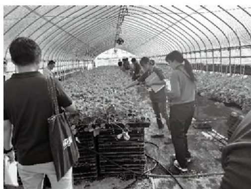
先進農家の育苗事例を学ぶ