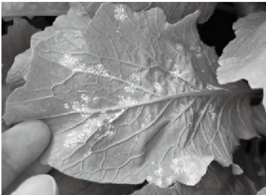
こかぶに発生した白さび病

④近年は耐病性を持った品種も出てきました。耕種的防除や薬剤防除と組み合わせるとより効果的な防除が期待できます。