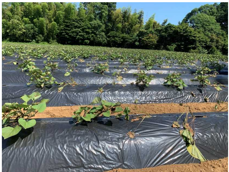
典型的なつる割れ症状(シルクスイート)