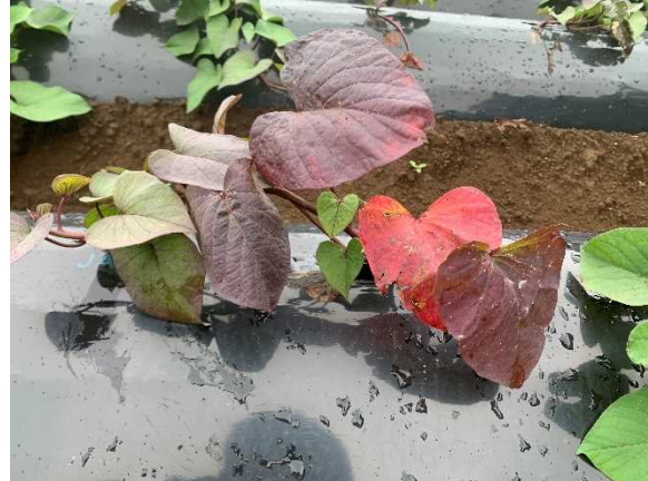
変色萎凋(ベニアズマに多い)