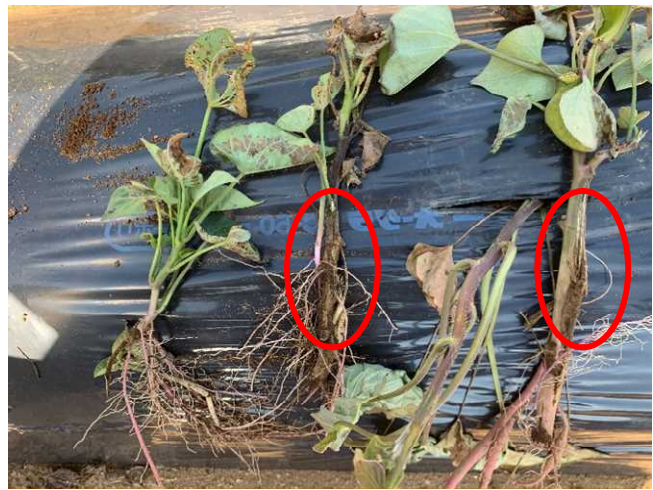
黒変するつる割れ病