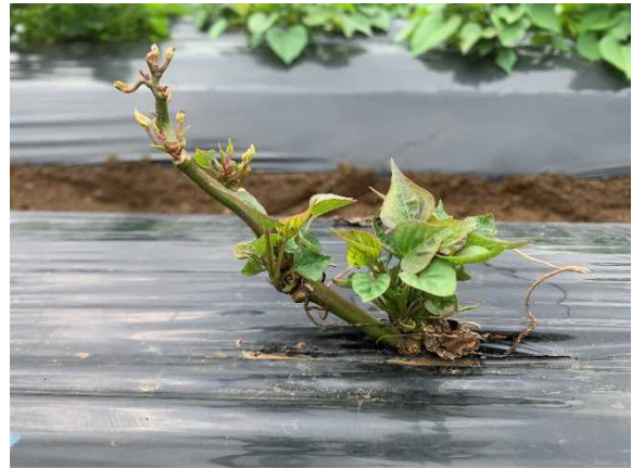
落葉後の異常萌芽(べにはるか)