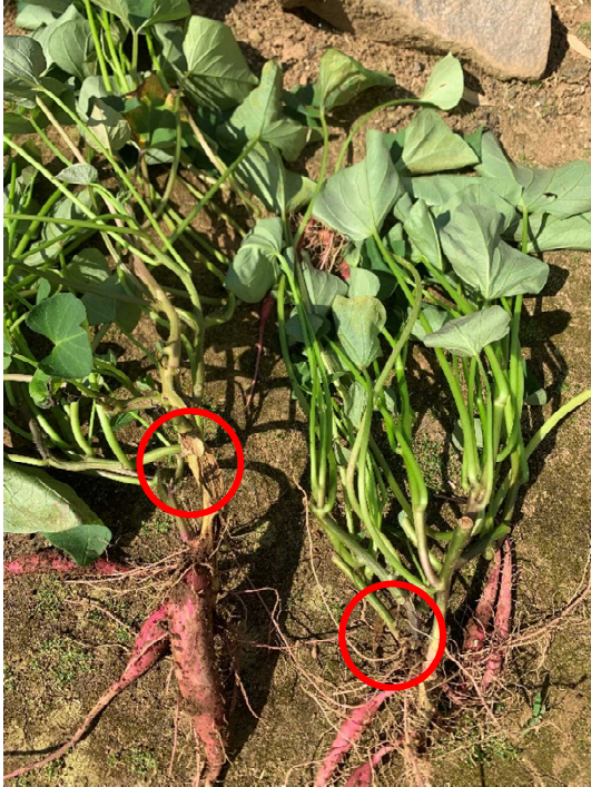
育苗中に発生したつる割れ病