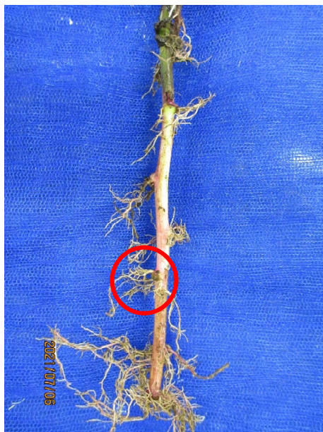
イモになる太い根がほとんどない