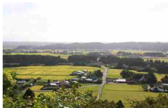
千葉県南東部の太平洋側に位置