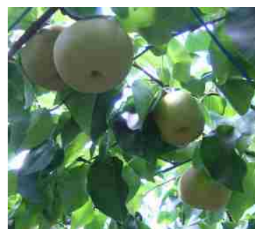
地域を代表する品目「なし」

「なし」以外の果樹では、定年世代等を中心に「ブルーベリー」栽培が拡大してきましたが、高齢化等により生産量が伸び悩んでいる