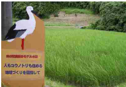
環境保全型農業の取組

さらに、いすみ市では、自然環境を生かした「自然と共生する里づくり」に取り組んでおり、平成 25 年度から、生物多様性に配慮した有機稲作の取組が始まり、現在学校給食の全量が有機米となっています。