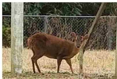
被害が増加傾向にある「キョン」