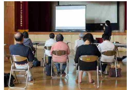
多様な担い手への研修

さらに、既存の農業経営体については、大規模化、GAP（農業生産工程管理）手法、スマート農業の導入、法人化などにより、効率的で収益力のある農業経営を展開する必要があります。