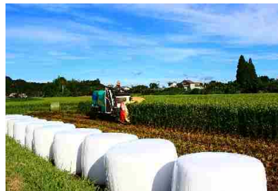
稲 WCS の収穫作業

畜産については、輸入牧草やトウモロコシに代わる、安全・安心で適正な価格の国産飼料を生産していくため、低コスト生産、生産物の品質向上、収量の増加、需要の拡大を図るための新たな仕組みを作ることが必要となっています。また、耕種農家の利用しやすい良質堆肥の生産と耕畜連携が重要となっています。さらに、地域内の飼料供給体制の整備に向け、TMRセンター設立等の支援が必要となっています。