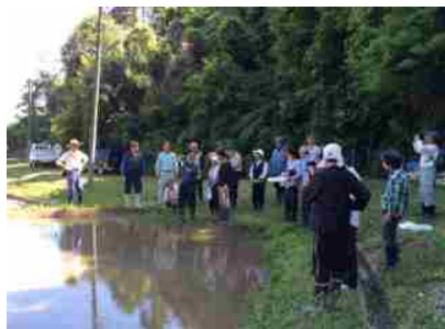
有機米生産のための栽培講習会