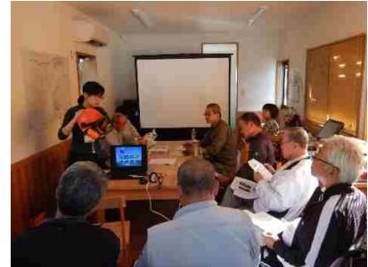
木の駅プロジェクト安全講習会

森林所有者に代わって森林組合が整備を実施していますが、1戸当たりの所有面積が小さいことから、施業の集約化が思うように進まず、地形が急峻で複雑なことから、整備面積の拡大が難しい状況です。また、地域林業の中核的担い手である森林組合の育成強化と、新たな林業事業体の森林整備への参入を図ることが課題となっており、併せて、森林整備の効率化や林産物の販売価格の向上への取組も必要となっています。