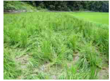
イノシシによる水稲の被害

鳥獣害対策は、防護、捕獲、環境管理の対策を組み合わせることで実施することが効果的であることから、今後も継続的にこれらの取組を実施していく必要があります。