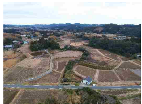
谷津田で狭小な農地

管内の基盤整備率は、県平均の水田 58.1%、畑等 33.7%に対して、水田 69.8%、畑等 17.2%となっています。平坦地域では耕地の大区画化や担い手農家等への土地利用集積を進め、経営規模の拡大や大型機械の導入による生産コストの低減を図るための取り組みが行われています。しかし、耕地のほとんどが、重粘土水田で、過去に実施した事業は、稲作に特化した条件整備事業が多く、また土地改良施設の耐用年数が超過するなど老朽化が進行しています。