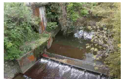
老朽化した頭首工

数少ない担い手だけでは生産基盤の維持管理作業に支障をきたす農地も多く、特に担い手不足が顕著な地域では、耕作放棄地の拡大を招いています。既存の土地改良施設の相当数は、耐用年数を超過するなど老朽化が進行しており、適確な機能診断・整備補修と維持管理が重要な課題となっています。