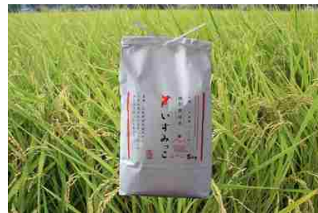
ブランド米「いすみっこ」