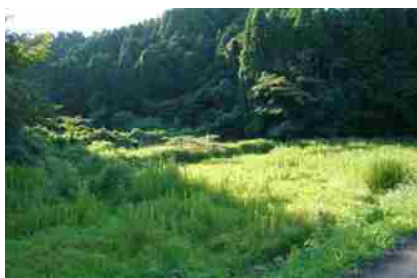
山間谷津田の耕作放棄地

高齢化や過疎化の進行による担い手不足により、特に中山間地における農地の耕作放棄が進み、そこが新たな生息地となることで、イノシシやシカ等の野生鳥獣による農作物被害が深刻となっています。野生鳥獣被害は農業者の営農意欲を低下させ、耕作放棄地を増加させる一因となっており、野生鳥獣の棲み家となる耕作放棄地の増加が更なる野生鳥獣被害を招くという悪循環を生じさせています。