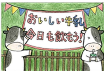
令和4年度おいしい牛乳ありがとう 絵手紙コンクール作品

畜産経営体は、習志野市を除く千葉市、市原市、八千代市にあり、住宅地に隣接するものから、農業地域、丘陵地域に至るまで点在しています。