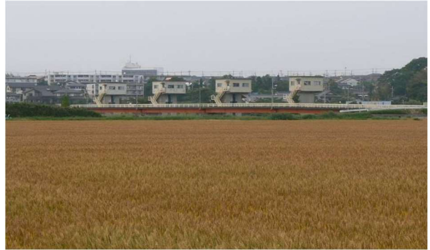
写真：市原市海上地区の麦作と西広堰

当地域の先人たちは、河川の豊かな水の恵みを利用した「水車」、「板羽目堰」等の歴史的・文化的に価値のある利水技術を考案し、耕地整理とともに地域の農業を発展させてきました。