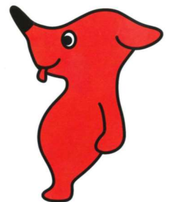
千葉県マスコットキャラクター 「チーパくん」

分庁舎（〒266-0014 千葉市緑区大金沢町 473-2）企画振興課・改良普及課