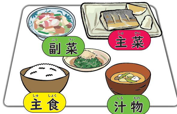
図8-1 配膳（膳組）の基本